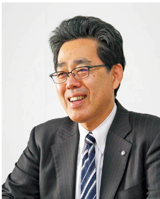
川島 隆太 (かわしまりゅうた)

1959年千葉県生まれ。1989年医学博士(東北大学)。1991年スウェーデン王国カロリンスカ研究所客員研究員。1993年東北大学加齢医学研究所助手、2001年同教授、同大学未来科学技術共同研究センター教授、2006年同大学加齢医学研究所教授を経て、2014年同研究所所長。ニンテンドーDS用ソフト「脳トレ」シリーズの監修者。著書に、「脳を鍛える大人のドリル」シリーズをはじめ、「現代人のための脳鍛錬」(2007年、文春新書)、「さらば脳ブーム」(2010年、新潮新書)、「スマホが学力を破壊する」(2018年、集英社新書)など多数。