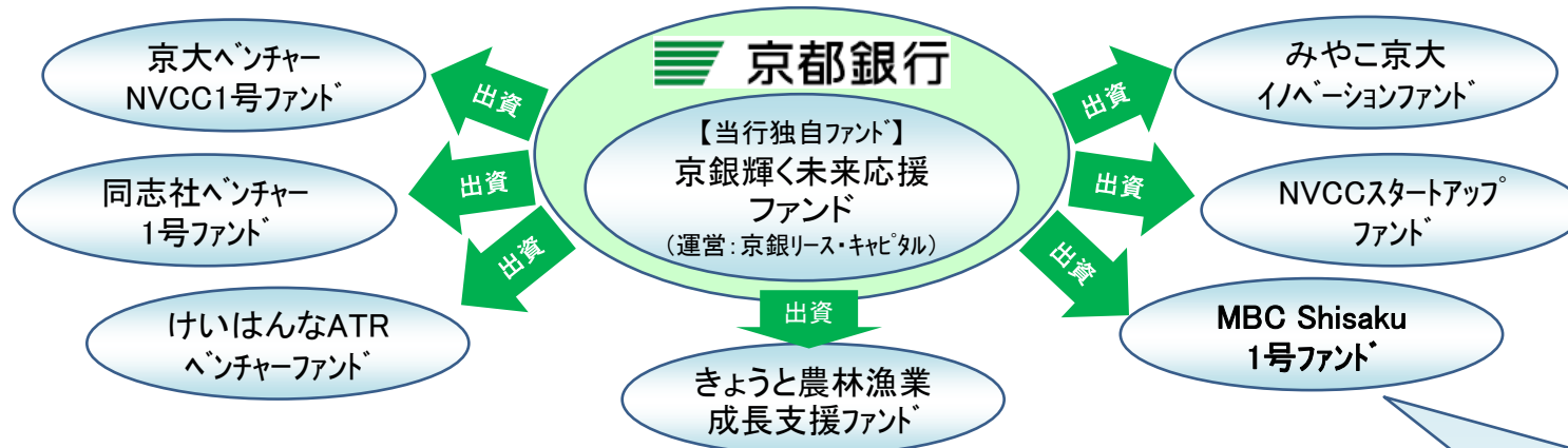
【京銀輝く未来応援ファンド投資実績（平成29年度）】

その他にも、地元の創業企業やベンチャー企業の支援育成に資する各種ファンドへも出資を行い、幅広い観点で成長資金の支援に取り組んでおります。