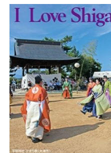
右:「平野神社 けまり祭」 (大津市)