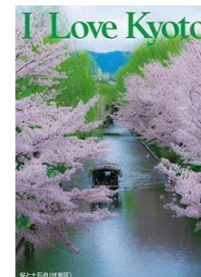
左:「桜と十石舟」 (伏見区)

「歴史都市・京都」の素晴らしさを再発見し、将来にわたってまもり育ててゆこうという趣旨から、昭和57年より「I Love Kyotoキャンペーン」を展開。作製したポスターは、458種類、約68万枚を数えます。また、平成25年より滋賀県において、滋賀の四季折々の心豊かな情緒や風情を皆さまに幅広く伝えるため「I Love Shiga キャンペーン」を展開しています。