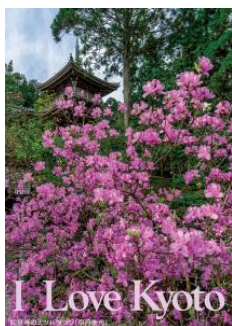
「如意寺のミツバツツジ」(京丹後市)

「歴史都市・京都」の素晴らしさを再発見し、将来にわたってまもり育てていこうという趣旨から、1982年より「I Love Kyotoキャンペーン」を展開し、作製したポスターは479種類、約70万枚を数えます。また、2013年より滋賀県において、滋賀の四季折々の心豊かな情緒や風情を皆さまに幅広く伝えるため「I Love Shigaキャンペーン」を展開しています。