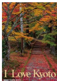
「龍穩寺への参道」(南丹市)