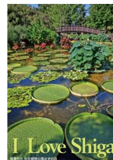
「草津市立 水生植物公園みずの森」