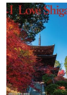
「湖南三山 常楽寺」(湖南市)