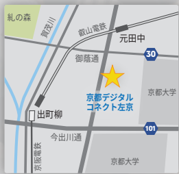
叡山電鉄 元田中駅より徒歩5分 市バス 飛鳥井町バス停より徒歩1分