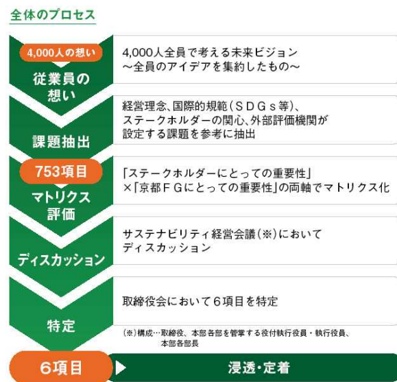
図表 2 マテリアリティ特定のプロセス 5

京都 FG は、従業員の想いをベースとしてボトムアップでマテリアリティの特定を行った（図表 2）。具体的には、最初に、前身の京都銀行グループ時代に全従業員を対象に実施した「4,000 人で考える未来ビジョン」で取りまとめた従業員の想いを軸として、国際基準・ガイドライン、ESG 評価機関等からの要請に加え、京都 FG の環境認識や企業理念、成長戦略との整合性を勘案し、753 の課題を抽出した。次に、抽出した課題について京都 FG の経営戦略やサステナビリティ等の視点から 30 の課題に整理及び統合を行った。最後に「ステークホルダーにとっての重要性」及び「京都 FG にとっての重要性」の軸で評価及び議論を行い、最終的に 6 つのマテリアリティを特定した（図表 3）。京都 FG はマテリアリティに関連した各種取組を推進することで、多面的に地域の課題解決に取り組んでいる。