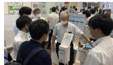
2023年開催 地域×Techの様子