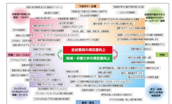
「京都銀行未来ビジョン」での意見を集約した図