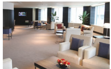
京銀お客さまサロン