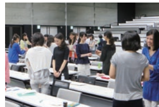
かがやきセミナー