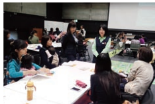
育休職場復帰サポート講座