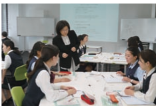
女性主任マネジメント研修

女性行員がより一層活躍の範囲を広げ、キャリアアップしていけるよう、様々な研修を実施。管理職への昇格を目指すマネジメント研修や、女性の法人営業担当者を養成するプログラムなど、多様な取り組みが行われています。