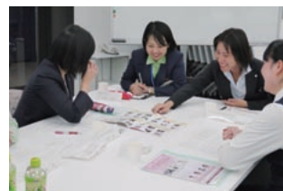
かがやきサポートチームミーティング

女性行員がいきいきとかがやける職場づくりを目指し、かがやきサポートチームの創設による各種企画の推進、自分自身を見つめ直し、今後の働き方について考える機会とする「かがやきセミナー」の開催など、多様な取り組みを実施しています。