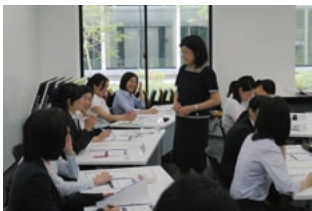
女性役席マネジメント研修