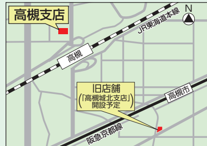
所在地:大阪府高槻市芥川町一丁目8番30号

なお、平成28年1月25日に高槻支店跡地に新たに「高槻城北支店」の開設を予定しております。