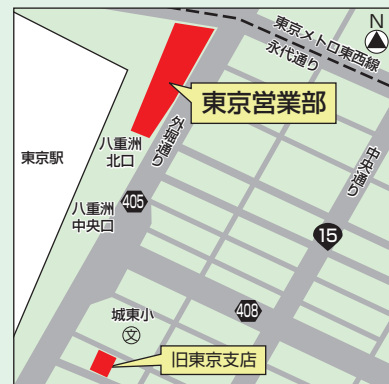
所在地:東京都千代田区丸の内一丁目8番2号 鉄鋼ビルディング 5階

同拠点には一部の本部組織やグループ会社の株式会社 京都総合経済研究所 東京経済調査部も移転し、機能を集中することにより、より一層の金融サービスの充実を図ってまいります。