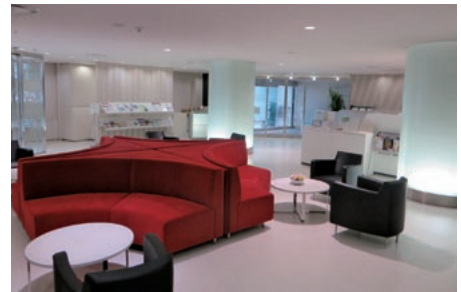
京銀コンサルティングプラザ