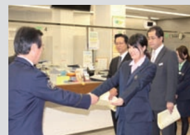
宇治警察署からの表彰(小倉支店)