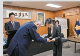
北警察署からの表彰(白梅町支店)