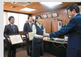
山科警察署からの表彰(山科支店)