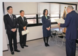
西京警察署からの表彰(西桂支店)