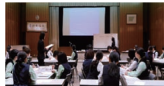
CSリーダー会議(接遇研修)

行員一人ひとりが日頃からお客さま本位のサービスを実践することができるよう、行員向けの研修や外部講師によるCSセミナーなどを定期的実施しております。