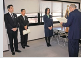
西京警察署からの表彰(西桂支店)