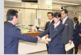
宇治警察署からの表彰(小倉支店)