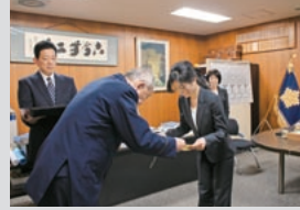
北警察署からの表彰(白梅町支店)