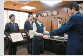
山科警察署からの表彰(山科支店)