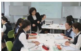
女性主任マネジメント研修

女性行員がより一層活躍の範囲を広げ、キャリアアップしていけるよう、様々な研修を実施。管理職への昇格を目指すマネジメント研修や、女性の法人営業担当者を養成するプログラムなど、多様な取組みが行われています。