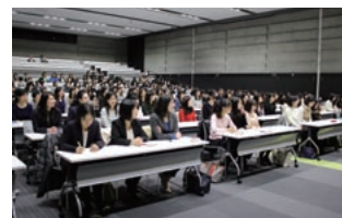
ワークショップ「きららかがやけ私らしく」

女性行員がいきいきとかがやける職場づくりを目指し、かがやきサポートチームの創設による各種企画の推進、自分自身を見つめ直し、今後の働き方について考える機会とするワークショップ「きららかがやけ私らしく」の開催など、多様な取組みを実施しています。