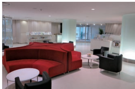
京銀コンサルティングプラザ