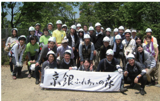
「京銀ふれあいの森」での整備活動

京都府は森林が面積のおよそ4分の3を占める緑豊かな地域です。この素晴らしい環境を次世代に引き継いでいくためにも、森林保全への取組みを積極的に推進しております。