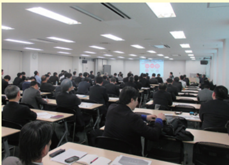
IPOセミナーin京都2018(平成30年2月)

創業企業やベンチャー企業、新しい事業分野への進出を検討されているお取引先のサポート体制の充実に努めております。新たに株式会社東京証券取引所と基本協定を締結し、株式上場に向けたセミナーの開催などをおこなったほか、日本政策金融公庫との連携を強化し、より充実した支援に取り組んでおります。