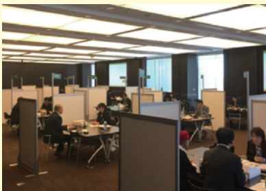
関西の逸品!首都圏バイヤー商談会in東京2018 (平成30年3月)

広域に展開する当行の店舗ネットワークと情報網を活用し、ビジネスマッチングや商談会の開催などによるお取引先の販路拡大等をサポートしております。また、人材確保・定着支援にも取り組んでおり、各種セミナーの開催や人材会社との提携等に取り組んでおります。