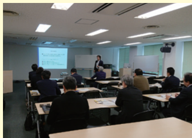
人材確保・定着セミナー(平成29年10月)