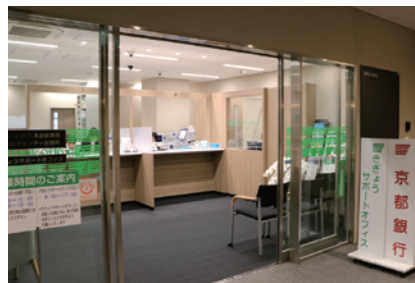
京都市下京区四条通室町東入函谷鉾町78番地 京都経済センター3階