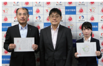
認定通知書交付式

2019年7月、育児休業者向け職場復帰の支援講座やキャリア開発支援の取り組みが評価され、「プラチナくるみん認定」を受けました。