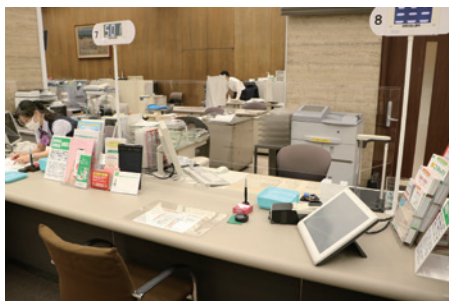
飛沫防止シートの設置

また、従業員の在宅勤務を活用した2交代制勤務や分散勤務の導入等、業務継続体制の強化を図りました。