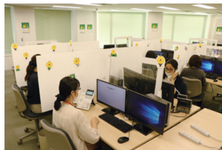
パーテーションの設置