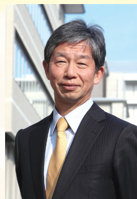
京都大学 iPS細胞研究所 所長/教授