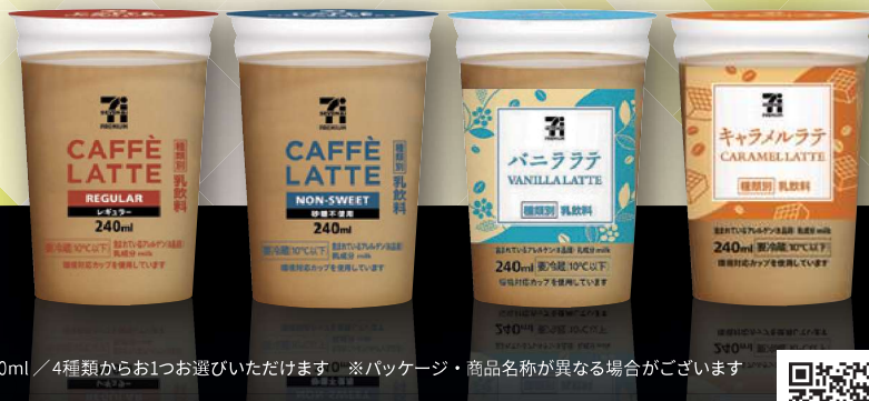
240ml / 4種類からお1つ選びいただけます。 ※パッケージ・商品名称が異なる場合がございます。