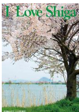
平湖から三上山を望む