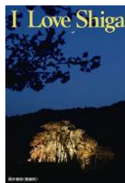
はたの夜桜(信楽町)