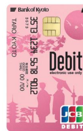
【京都シルエット(舞妓)】 (ピンク)