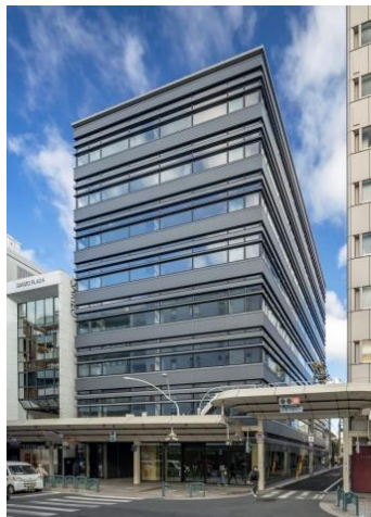
「大和証券京都ビル」 3階に店舗、1階にATMを設置